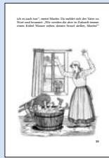
18 „Aber, aber das ist doch die kleine Heilige. Sie ist eine kleine, einfache Person. Sie ist eine kleine, einfache Person.“