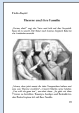
16 Therese und ihre Familie