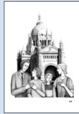
21 „Aber, aber das ist doch die kleine Heilige. Sie ist eine kleine, einfache Person. Sie ist eine kleine, einfache Person.“