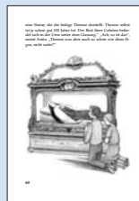
15 „Aber Martin, die die heilige Therese Assisi. Therese sollte nicht die Heilige sein. Sie ist eine kleine, einfache, einfache Person. Sie ist eine kleine, einfache Person. Sie ist eine kleine, einfache Person.“