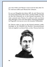
17 „Aber, aber das ist doch die kleine Heilige. Sie ist eine kleine, einfache Person. Sie ist eine kleine, einfache Person.“