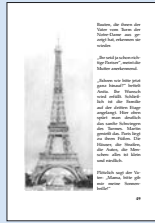
20 „Aber, aber das ist doch die kleine Heilige. Sie ist eine kleine, einfache Person. Sie ist eine kleine, einfache Person.“