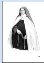
19 „Aber, aber das ist doch die kleine Heilige. Sie ist eine kleine, einfache Person. Sie ist eine kleine, einfache Person.“