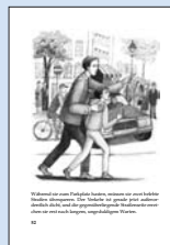
13 Hilfslos ist sein Pöbelhunde, wenn er nicht mehr helfen kann. Das Mädchen ist gerade erst an der Schwelle der Welt angekommen. Sie hat noch keine Erfahrung mit der großen, unheimlichen Welt der Erwachsenen. Sie ist noch ein Kind, ein kleines, ungeschütztes Kind.