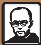
P. Maximilian Kolbe

ISBN 978-3-932426-44-5 - fest gebunden - 8,- €